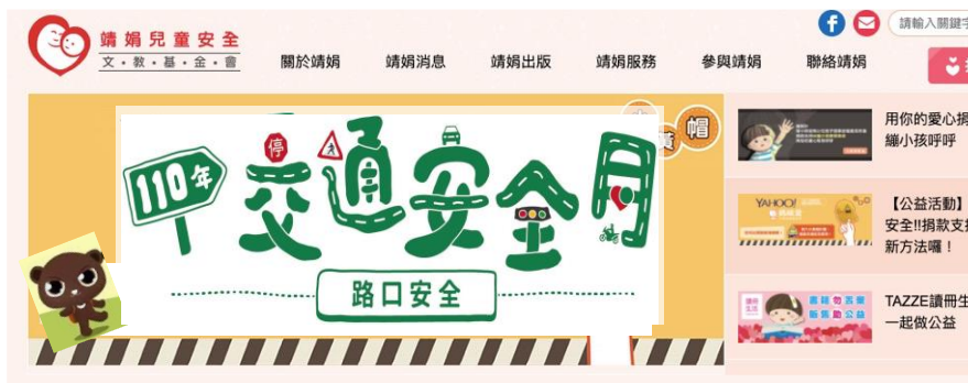
▲ 官網加交安月 Banner