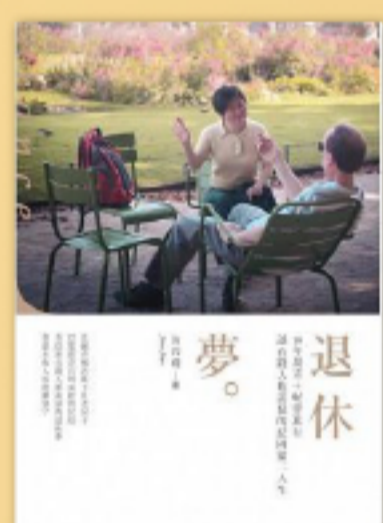
理財規劃 觀念翻轉，啟動永不嫌晚