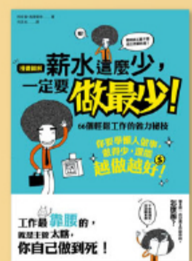
效率工作 工作力就是賺錢力