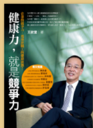
身心平衡 健康才是最大的資本